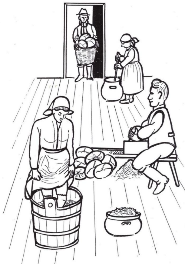
Krouhání zelí na velkých struhadlech. Vpředu šlapání zelí v bečce, vzadu pěstování zelí do velkých kameninových nádob

Zelí v Žerotíně, a na Hané vůbec, pěstovalo v řepě. K té Hanáci zpočátku moc nepřirostli. „Deť s ňó bévala jenom ošťara“. A tak „cokrufko šedile, jak se dalo“. Seli do ní mák, mrkev, „rábko“ – i zelí. Sem tam bývalo vidět i kousky zelí zvlášť.