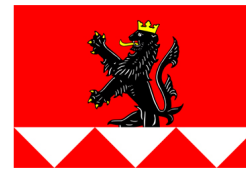
Konečná verze a současná podoba vlajky a znaku obce Žerotín

Popis znaku obce Žerotín je následující: „V červeném štítě černý korunovaný lev se zlatou zbrojí a jazykem, vyskakující ze tří dolů obrácených kuželů.“ Vlajka obce je popisována následovně: „Červený list se třemi bílými rovnoramennými vzájemně se dotýkajícími trojúhelníky s vrcholy na dolním okraji listu. Výška trojúhelníků je rovna jedné čtvrtině šířky listu. Z prostředního vyskakuje černý lev se žlutou korunou a zbrojí. Poměr šířky k délce je 2:3.“