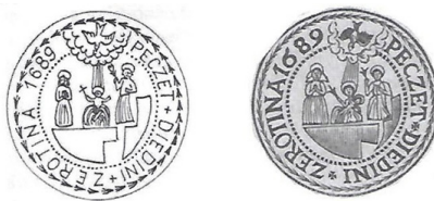
Zrcadlové otisky typáře nejstarší rychtářské pečeti Žerotína z roku 1689